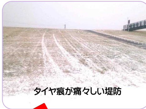
タイヤ痕が痛々しい堤防

この行為は「 河川法 第16条の4第1項(河川を損傷すること。) 」により、違反したものは 6ヶ月以下の懲役又は30万円以下の罰金 に処されます。